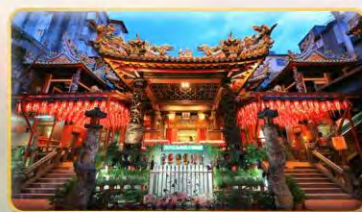
วัดเทียนฮั่ว จอพรเจ้าแม่มาจู่