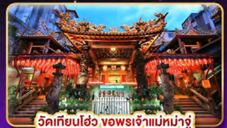
วัดเทียนโฮ่ว ขงพรเจ้าแม่มาจู่