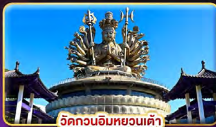
วัดกวนอิมหยวนเต้า