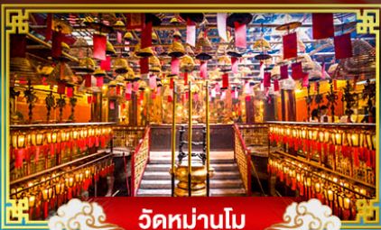
วัดมานโม