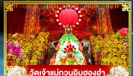
วัดเจ้าแม่กวนอิมสองซ่า