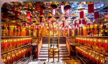
วัดหม่านโม