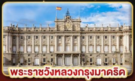
พระราชวังหลวงกรุงมาดริด