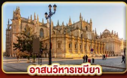
อาสนวิหารเซบิยา