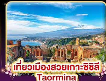
เที่ยวเมืองสวยเกาะซซิลี Taormina