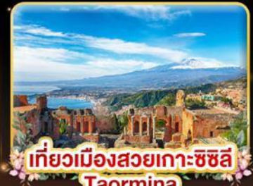
เที่ยวเมืองสวยเกาะซซิลี Taormina