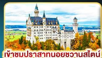
เข้าชมปราสาทนอยชวานสไตน์

"เก็บครบทุกมิติ" คัดสรรความเป็น "ที่สุด" ของยุโรปตะวันออกครบถ้วน