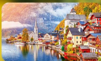
การันตีพัก Hallstatt / St. Wolfgang หรือริมทะเลสาบ 1 คืน