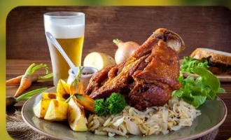
พิเศษ! ลิ้มลองเมนูประจำชาติ ทั้ง 5 ประเทศ!!!