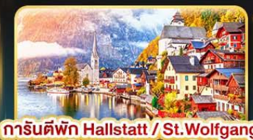
การันตีพัก Hallstatt / St. Wolfgang หรือริมทะเลสาบ 1 คืน