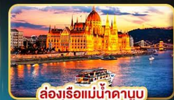
ล่องเรือแม่น้ำดานูบ ช่วง Twilight