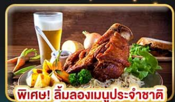
พิเศษ! ลิ้มลองเมนูประจำชาติ ทั้ง 5 ประเทศ!!!