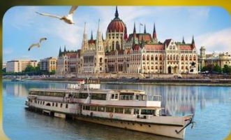
ล่องเรือแม่น้ำดาบูบ พร้อมจิบแชมเปญ