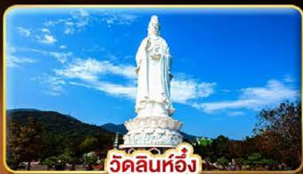
วัดลินห์อึ้ง