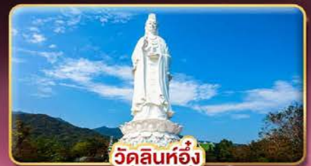
วัดลินทอ้ง