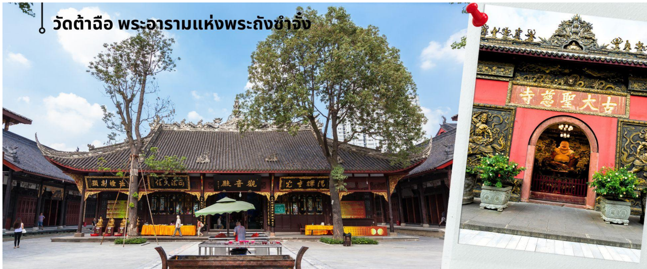
วัดต้าฉือ พระอารามแห่งพระถังซำจั๋ง

เดินทางกลับเจิ้งตูชม วัดต้าฉือ พระอารามแห่งพระถังซำจั๋ง ใจกลางนครเจิ้งตู พระถังซำจั๋ง ได้รับการสรรเสริญว่าเป็นผู้มีความเพียร และมีชื่อเสียงมายาวนานกว่า 1,400 ปี และยังได้รับการยกย่องว่าเป็น พระไตรปิฎกแห่งราชวงศ์ถัง พุทธประวัติของพระถังซำจั๋งถูกจารึกในสถานที่ต่างๆ มากมาย รวมไปถึงได้ถูกกล่าวถึงในจดหมายเหตุหลายเล่มตามเส้นทางการเดินทางแห่งความเพียรของท่าน รวมทั้งมีพระอัฐิของท่าน ประดิษฐานอยู่ในพระอารามของนครนานจิง และที่ทะเลสาบสุริยันจันทราเป็นเกาะได้ในวันอีกด้วย