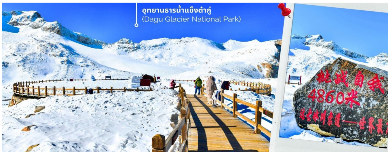
ความหนาวของหิมะขึ้นอยู่กับสภาพอากาศ

เช้า 📍 รับประทานเช้า ณ ห้องอาหารของโรงแรม (4) จากนั้นนำท่านเดินทางสู่ เมืองเฮยส่วย (ใช้เวลาเดินทางประมาณ 2 ชั่วโมง) เพื่อเดินทางไปยัง อุทยานธารน้ำแข็งต้ากู่ (รวมกระเช้าขึ้นลง) ต้ากู่ปิงชว่น หรือ Dagu Glacier National Park เป็นธารน้ำแข็งกลางเขี้ยวที่สวยงามที่สุดแห่งหนึ่งของโลกและเป็นสถานที่ท่องเที่ยวระดับ 4A ของจีน ตั้งอยู่ที่เมืองเฮยส่วย ในมณฑลเสฉวน ห่างจากเมืองเฉิงตู ประมาณ 300 กิโลเมตร ถือเป็นธารน้ำแข็งที่อายุน้อยที่สุด ที่ตั้งอยู่ในระดับความสูงที่ต่ำที่สุดและอยู่ใกล้กับเมืองมากที่สุด ในบรรดาธารน้ำแข็งทั้งหมด โดยอยู่สูงจากระดับน้ำทะเลประมาณ 3,800-5,100 เมตร จุดสูงที่สุดที่นักท่องเที่ยวสามารถขึ้นไปได้จะอยู่ที่ 4,860 เมตร