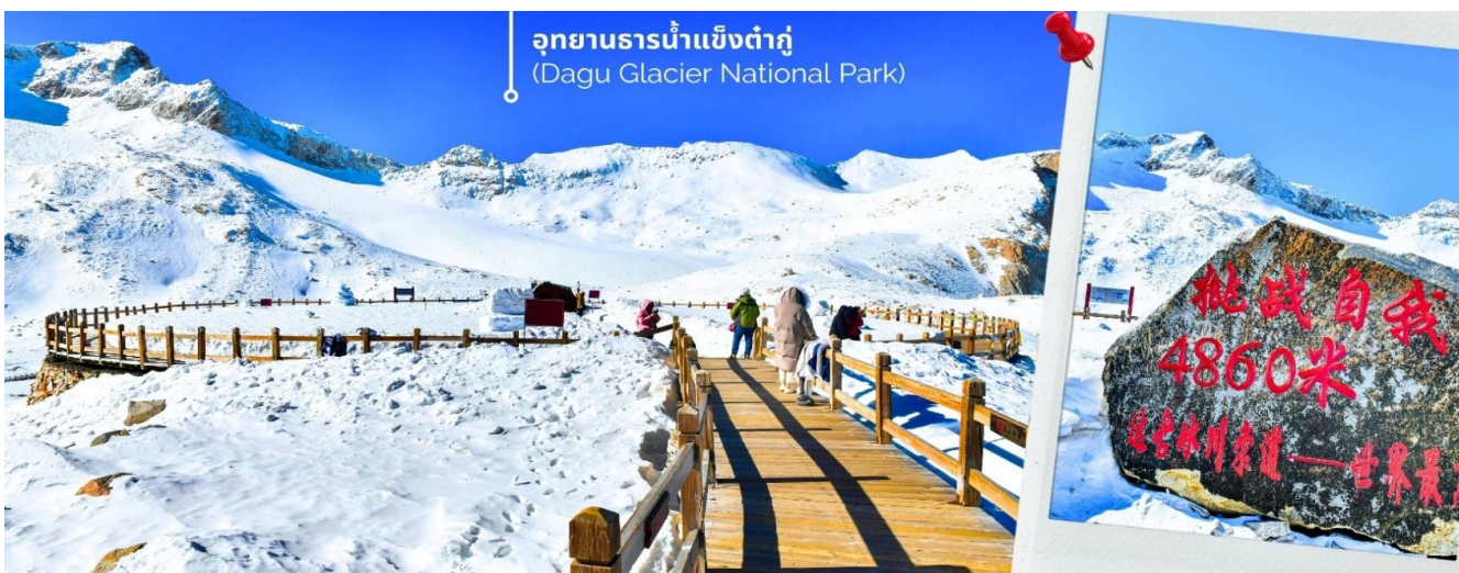
การตกและความหนาของหิมะขึ้นอยู่กับสภาพอากาศ

เช้า 📍 รับประทานเช้า ณ ห้องอาหารของโรงแรม (4) จากนั้นนำท่านเดินทางสู่ เมืองเฮยส่วย (ใช้เวลาเดินทางประมาณ 2 ชั่วโมง)เพื่อเดินทางไปยัง อุทยานธารน้ำแข็งต้ากู่ปิงชว่น(รวมกระเช้าขึ้นลง) ต้ากู่ปิงชว่น หรือ Dagu Glacier National Park เป็นธารน้ำแข็งกลาเซียร์ที่สวยงามที่สุดแห่งหนึ่งของโลก และเป็นสถานที่ท่องเที่ยวระดับ 4A ของจีน ตั้งอยู่ที่เมืองเฮยส่วย ในมณฑลเสฉวน ห่างจากเมืองเฉิงตูประมาณ 300 กิโลเมตร ถือเป็นธารน้ำแข็งที่อายุน้อยที่สุด ที่ตั้งอยู่ในระดับความสูงที่ต่ำที่สุด และอยู่ใกล้กับเมืองมากที่สุดในบรรดาธารน้ำแข็งทั้งหมด โดยอยู่สูงจากระดับน้ำทะเลประมาณ 3,800-5,100 เมตร จุดสูงที่สุดที่นักท่องเที่ยวสามารถขึ้นไปได้จะอยู่ที่ 4,860 เมตร